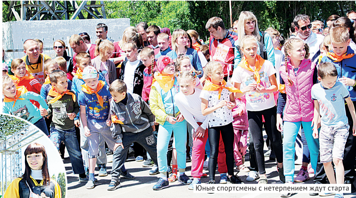
Юные спортсмены с нетерпением ждут старта