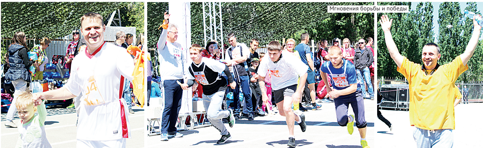
Мгновения борьбы и победы