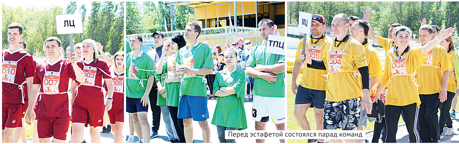
Перед эстафетой состоялся парад команд