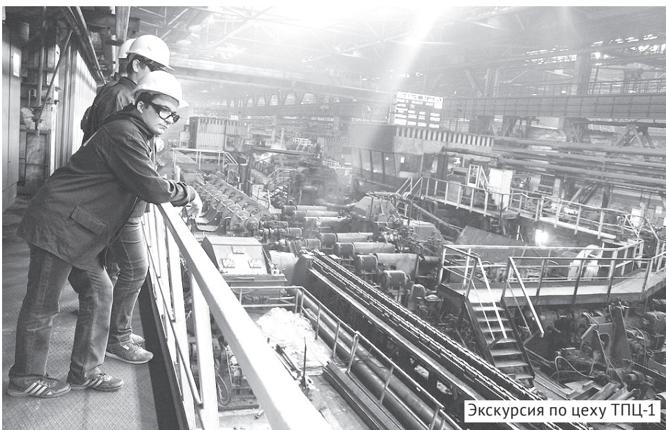
Экскурсия по цеху ТПЦ-1

В ней принял участие Волжский трубный завод, входящий в Трубную Металлургическую Компанию. В течение недели на предприятии побывали около ста студентов Волжского политехнического техникума, обучающихся по специальностям «Обработка металлов давлением», «Монтаж и техническая эксплуатация промышленного оборудования», «Техническая эксплуатация и обслуживание электрического и электромеханического оборудования».